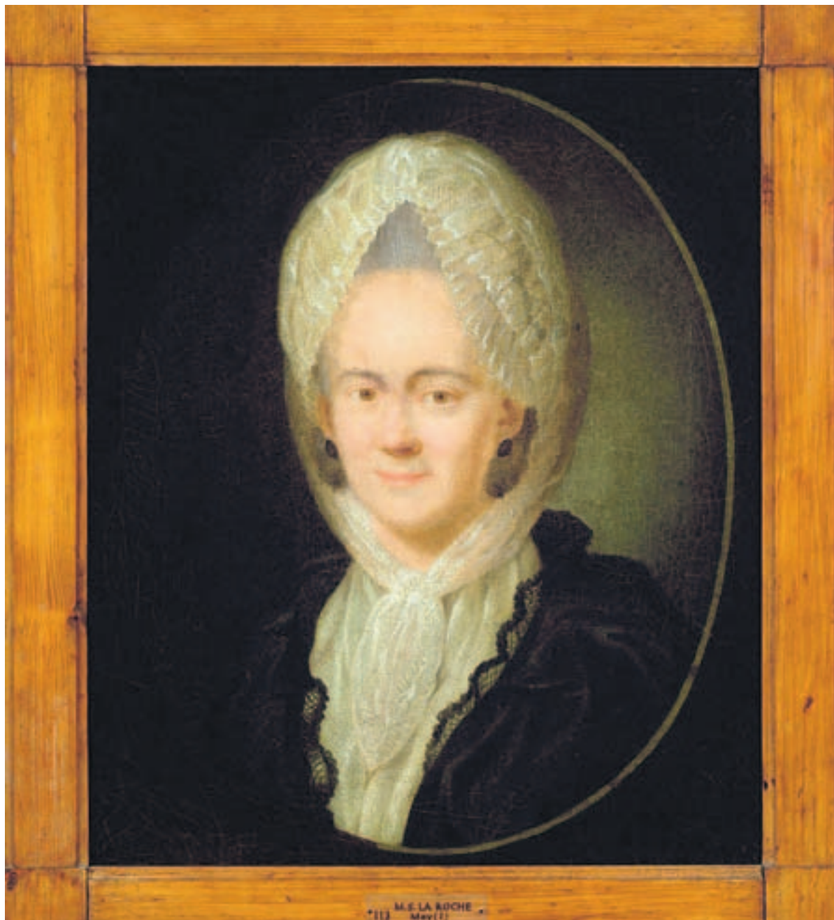
Sophie von La Roche auf einem Georg Oswald May zugeschriebenen Gemälde um 1776.

Als pietistisch erzogene Gelehrentochter verfügte Sophie über eine ausgezeichnete Ausbildung: Naturwissenschaft und Theologie waren ihr so geläufig wie Gedanken französischer Aufklärer. Sie wechselte mehrfach den Wohnsitz und reiste nicht nur durch ihre Bibliothek, sondern auch durch Europa. In unserer Region ist die eine Zeit lang in Speyer