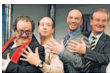
„Cloaca“ in Heidelberg.

Traurig, aber wahr, Kommunikation bleibt ein seltsames Ding. Im Zimmertheater Heidelberg, wo „Cloaca“ in der Inszenierung von Ute Richter